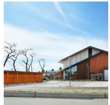
日光市民活動センター Shimin-katsudo-shien Centre

(Address: 304-1 Imaichi, Nikko TEL:0288-22-2271 )