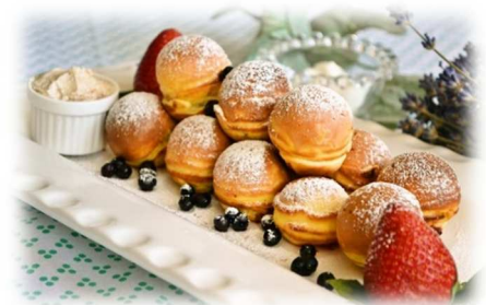
エイブルスキーヴァー (Æbleskiver)