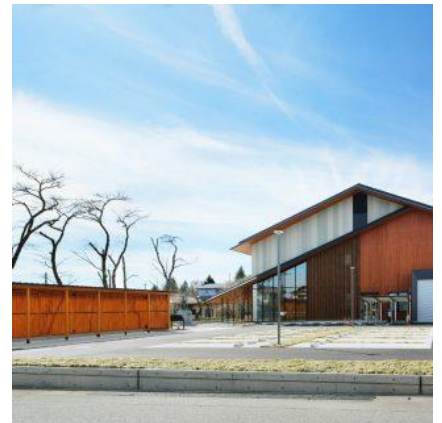
日光市民活動センター Shimin-katsudo-shien Centre

(Address: 304-1 Imaichi, Nikko TEL:0288-22-2271 )