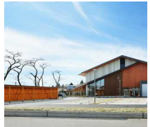
日光市市民活動センター NIKKO Civic Activities Support Center

（Address: 304-1 Imaichi, Nikko City TEL: 0288-22-2271）