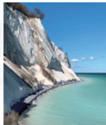
ステウンス・クリント (Stevns Klint)

デンマークにはこのような浜辺の町が多いです。この町に別荘とつり具などのマリネ用品を保管するための小屋があります。