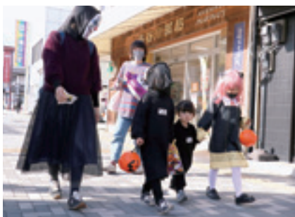
仮装してのまち歩き

まち歩きの後にはコスチュームコンテストを行い、ベストコスチューム賞6名を選出しました。また、ピニャータ（お菓子の入ったくす玉）を叩いて割る、アメリカの子供向けパーティーでよく行われるゲーム等を行い、アメリカのハロウィン文化を体験していただきました。また来年もお楽しみに☆