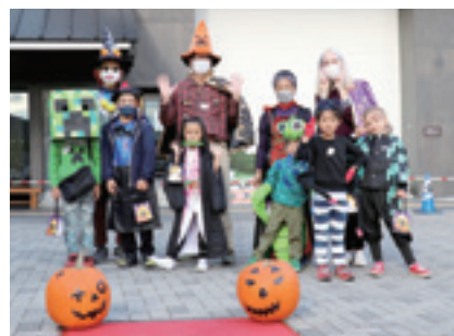
ベストコスチューム賞入賞者と審査員の方々