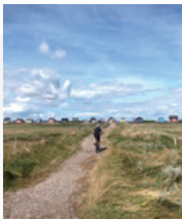
デンマークの浜辺

環境先進国であるデンマークは、風力発電の占める割合が高く、注目を集めている国です。