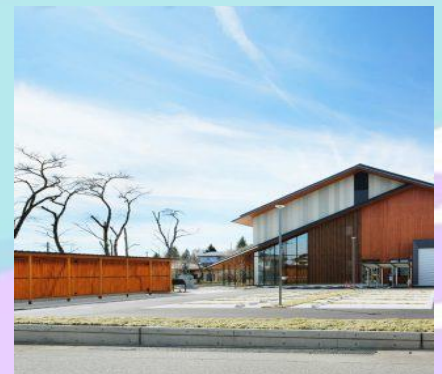
日光市市民活動センター NIKKO Civic Activities Support Center