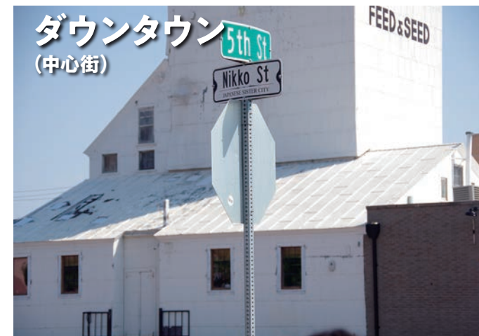
ダウンタウン (中心街)

郊外の平原地帯を抜けると現れる「荒れ地」という意味の場所です。まるで別世界のような岩山や大草原が広がる国立公園です。野生動物も多く生息しており、アメリカの大自然を体感できます。