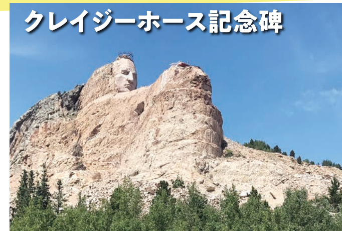
クレイジーホース記念碑

4人のアメリカ大統領の顔が岩山に刻まれた巨大な記念碑です。高さ18メートルの彫刻は迫力満点!アメリカの歴史を象徴する有名スポットです。日光市民の皆さんはきっと見たことあるはず!笑