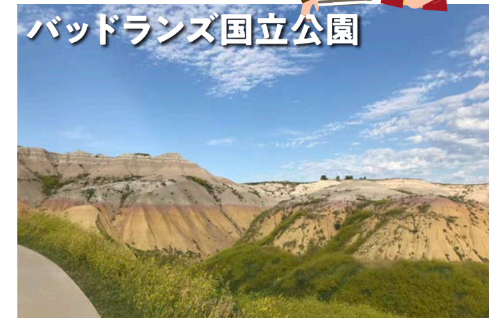
バッドランズ国立公園

ネイティブアメリカンの英雄クレイジーホースを刻んでいる巨大な彫刻です。現在も制作が続けられており、完成すれば世界最大級の岩山彫刻になる予定です。